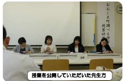
授業を公開していただいた先生方