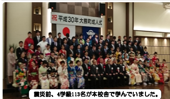
震災前、4学級113名が本校舎で学んでいました。

1月7日(日)グランプルティいわきで、成人式が行われました。平成24年度卒業生(震災当時1年生)が対象でした。