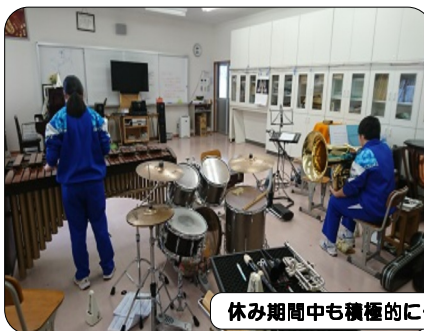
休み期間中も積極的に体力向上や部活動を行いました

風雪に耐えながら植物は美しい花を咲かせる準備をしています。目標を常に掲げ前進し、それぞれの春を自分の手で引き寄せてほしいと思います。