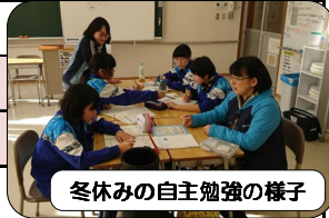
冬休みの自主勉強の様子

風雪に耐えながら植物は美しい花を咲かせる準備をしています。目標を常に掲げ前進し、それぞれの春を自分の手で引き寄せてほしいと思います。