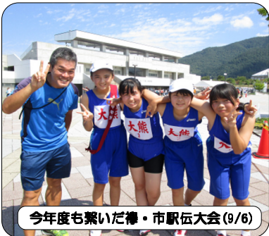
今年度も紫いだづ・市駅伝大会(9/6)

学校生活を楽しく充実したものにするためにも重要な要素です。ネットゲームやSNS等、長時間使用のリスクや正しい使い方を継続して指導するとともに、最新の情報を共有し、家庭との連携をさらに高めていきます。