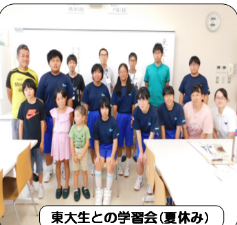
東大生との学習会(夏休み)