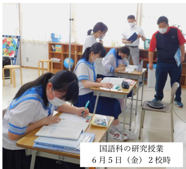
国語科の研究授業 6月5日(金) 2校時