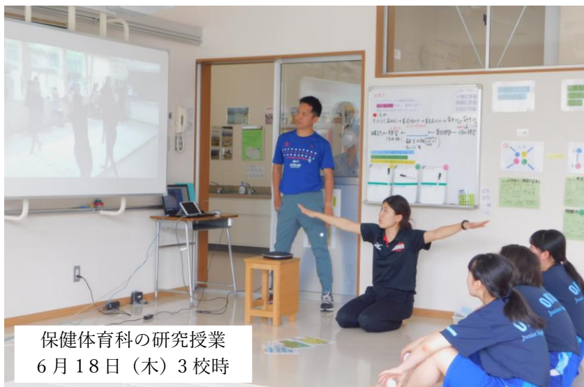
保健体育科の研究授業 6月18日(木) 3校時